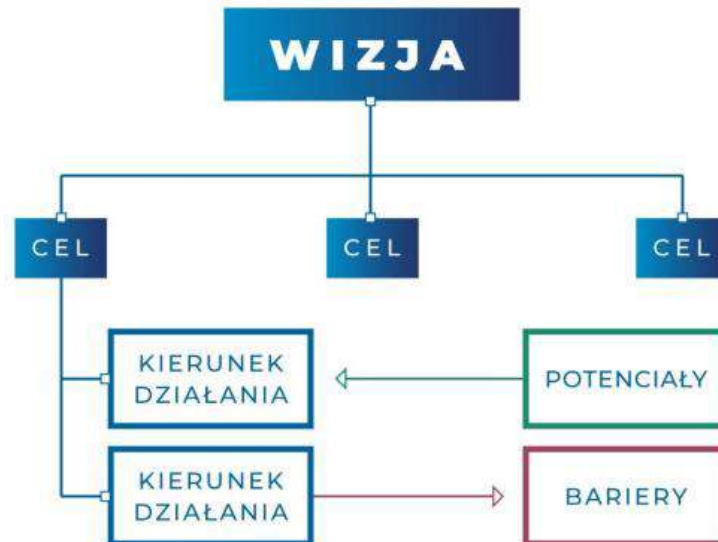
Rys. 1 Logika interwencji Strategii